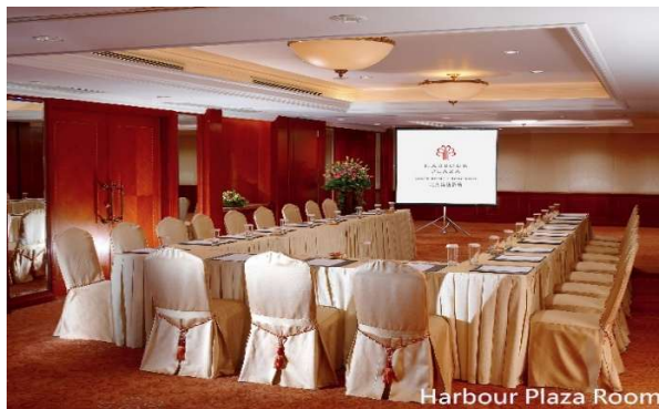
U字型セッティング