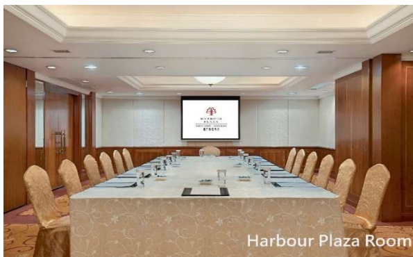
ボードルームセッティング