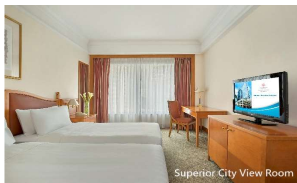
スーペリアシティビュールーム