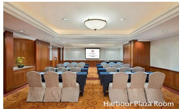
クラスルームセッティング